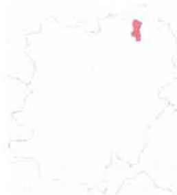
Poziția localității Oțelu Roșu

Oțelu Roșu (1924: Ferdinandsberg) este un oraș în județul Caraș-Severin, Banat, România, format din localitățile componente Ciresa și Oțelu Roșu (reședința), și din satul Mal. Oțelu Roșu este amplasat pe o terasă aluvională, la 268 m altitudine, de-a lungul faliei tectonice, prin care râul Bistra, după confluența cu Bistra Mărului, se îndreaptă spre Timiș.